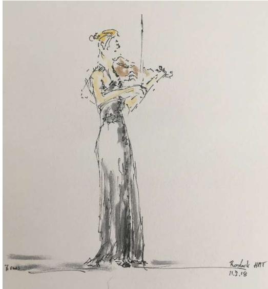
Das Werk des unbekanntes Künstlers